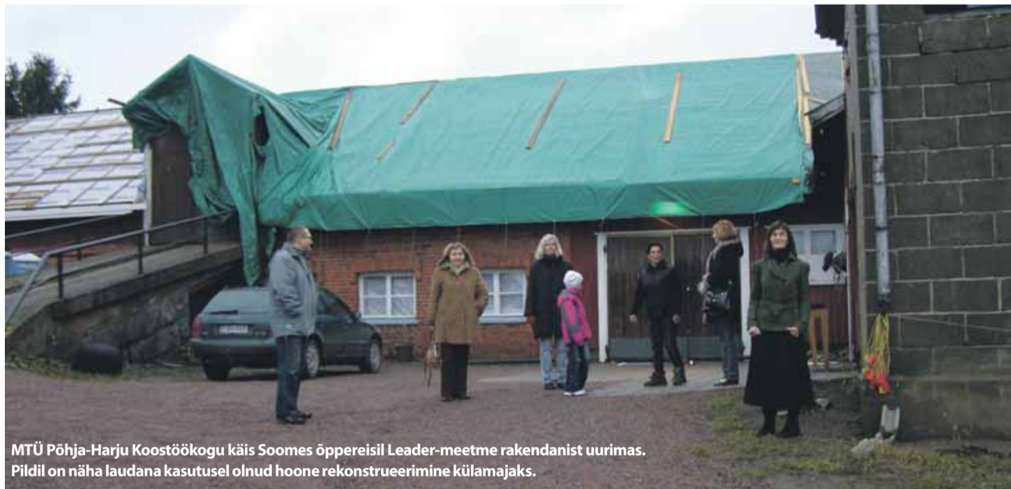
MTÜ Põhja-Harju Koostöökoostöökoos käis Soomes õppereisil Leader-meetme rakendanist uurimas. Pildil on näha laudana kasutusel olnud hoone rekonstrueerimine külamajaks.

■ Programmi eesmärk on kohalik areng ja piirkondade konkurentsivõime kasvatada kogukonna kaasamise ja tugevdamise.